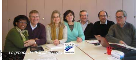
Le groupe de "Facilitateurs"