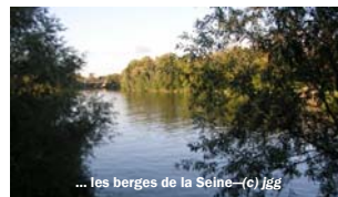
... les berges de la Seine - (c) jgg

Mairies Le Vésinet, Chatou, Montesson, Croissy, Association Tout Autre Chose Chanorier, Le Pecq, St Germain; Pôle Emploi St Germain – Sartrouville – Poissy ; Conseil général 78, Maison de l'Europe ; CCIV/CCIP, CEEVO95 ; APEC La Défense, Cergy, Montigny ; SGES, Perspectives & Emploi, EDM, SNC, CPE Paris, BAE, QuinquasCitoyens, PIVOD, BGE, Mission locale, ADmissions, O'Portage, ALTER&Co, Feature DDC, Optim'PME, ESAT Fourqueux, A Capital.