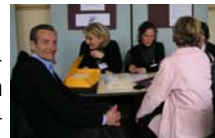
CQFD au Forum de l'Emploi (St Germain)

'Le monde de la biologie médicale'; 'Les Techniques d'entretiens téléphoniques'; 'La fonction d'achat'; 'Parler de soi' - 'Inventaire de personnalité - Sosie MBTI'; 'Relations Hiérarchiques / Motivations des collaborateurs'; Offre globale 'English Workshop'; 'Le droit du travail et sa mise en application'; 'Le métier du "Business Analyst"'; 'La Stratégie Marketing'; 'L'écoute active'; 'Présentation des média sociaux'; 'Le Médicament'