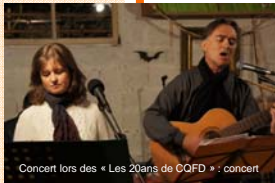
Concert lors des « Les 20ans de CQFD » : concert

Les NEWS sont accessibles sur notre Forum et téléchargeables.