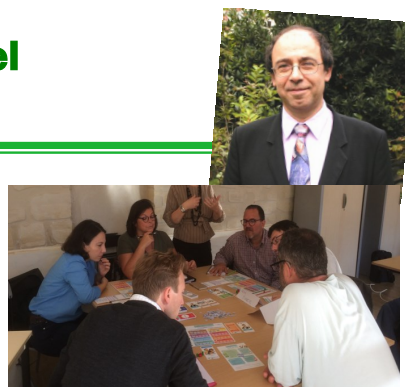
Réunion hebdomadaire en présentiel