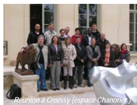
Réunion à Croissy (espace Chanorier)