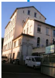
L'ESAT de Fourqueux

Les NEWS sont accessibles sur notre Forum http:// et téléchargeables.